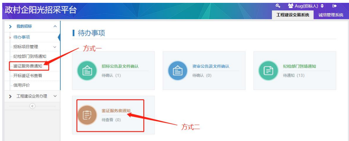
图 4-1 招标人查看鉴证服务费通知展示界面

收到鉴证服务费交纳通知的招标人，应在规定时间内将鉴证服务费交纳到天津农交所指定银行账户。具体查看界面如图 4-1 所示：