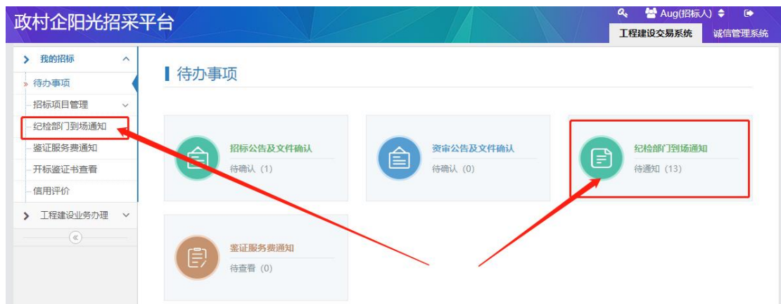
图 3-1 纪检部门当场通知确认界面操作图示

注：招标人可通过待办事项提醒当中的纪检部门到场通知进行已通知确认，也可通过选择 纪检部门到场通知 进行已通知确认。