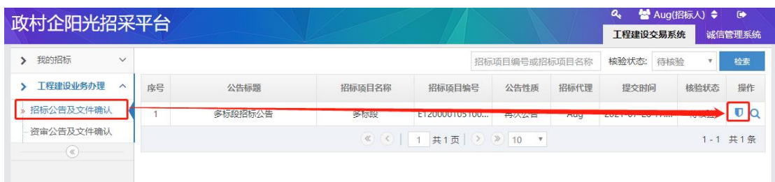
图 2-2 招标公告及文件确认界面操作图示（2）

注：① 招标人一级核验通过后，招标公告及文件进入到平台进行二级核验，二级核验通过后招标公告同时在天津市公共资源交易网和天津政村企阳光招采平台发布；