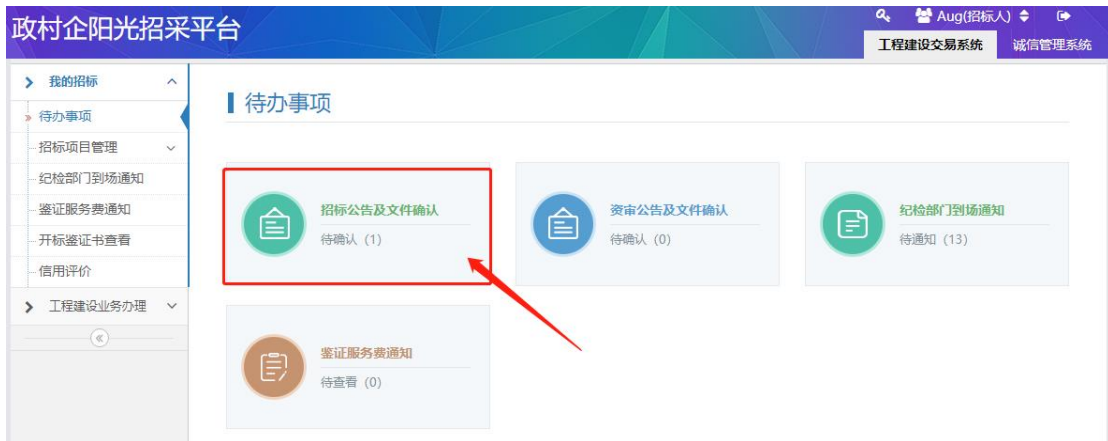
图 2-1 招标公告及文件确认确认界面操作图示（1）