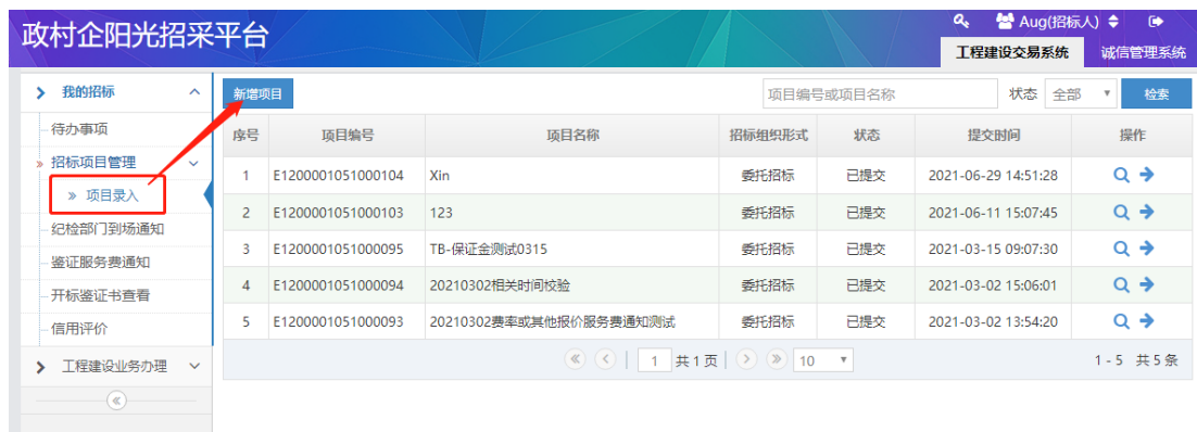
图 1-1 招标人新增招标项目操作图示

（2）选择新增项目后，招标人首先进行 招标项目概况 的信息录入，其次选择 新增招标代理 ，二者完成后方可提交。新增招标代理操作如图 1-2 所示：