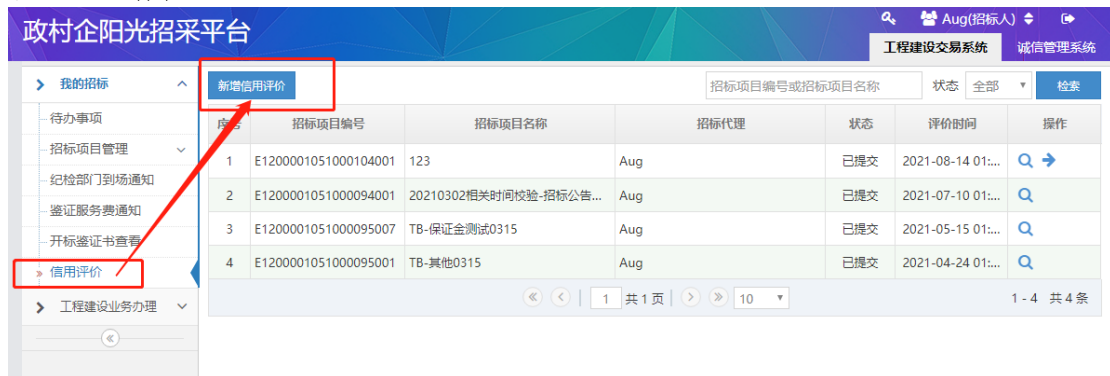
图 6-1 招标人信用评价进入界面操作图示

招标项目结束后，招标人需就投标人和招标代理在本次交易过程中的表现进行信用评价，评价为匿名方式。若交易结束后 15 天内未进行评价，系统则默认好评；若在评价后发现评价错误可在 30 天内，进行更改。具体信用评价操作如图 6-1 所示：