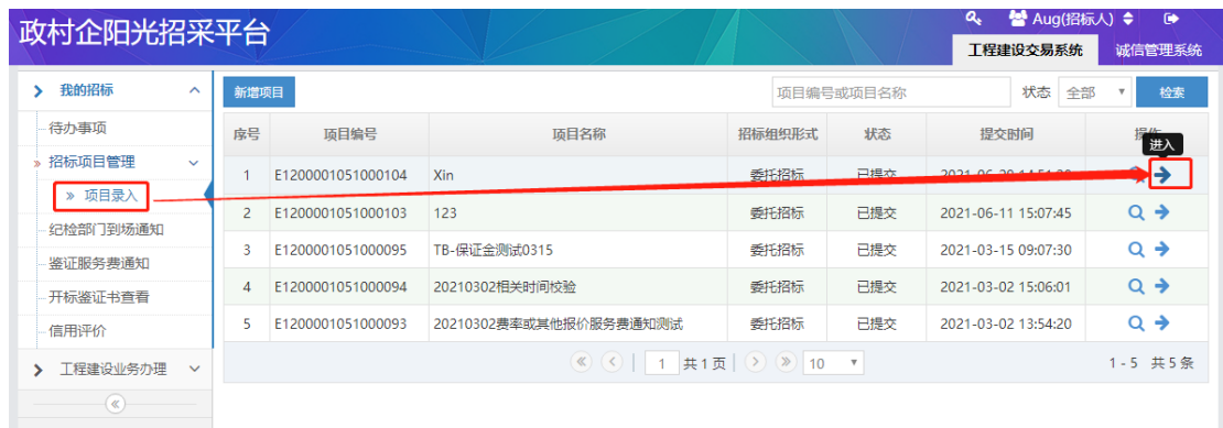
图 1-3 招标人委托多个招标代理单位操作图示

③ 招标人需要委托多个招标代理单位时,可在项目创建完成后选择 进入项目 -再次选择 新增招标代理 ,并按照以上两点完成提交,或在首次录入时完成多个招标代理单位选择。具体操作如图 1-3 所示: